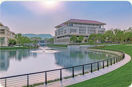
国教院 G20 土木 王凯恩

在薄薄的阳光下，享受一段诗酒趁年华的闲逸。看春日在金科的围篱里缓缓升腾，让我不由得想起了故乡苍翠的田野。（国教院 G20 土木工程(2) 班 顾成镇）