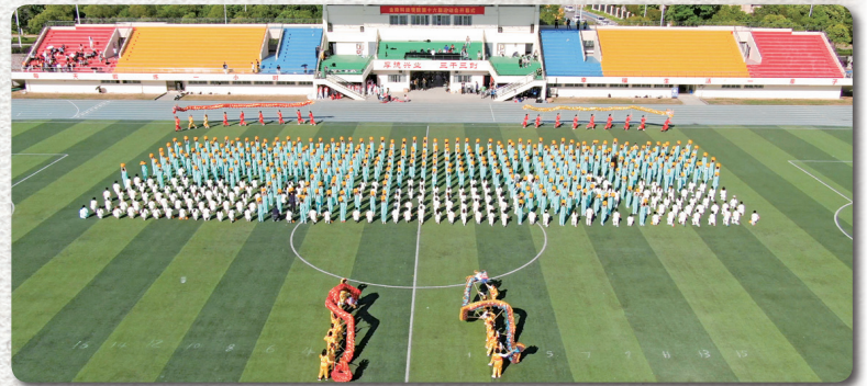
金陵科技学院第十六届运动会

随着秋天的到来，新的学年又开始了。此时此刻，不论你是刚刚步入大学，对大学生活充满着向往的新同学，还是已经走过大学四年即将步入社会对大学生活充满眷恋的学长学姐，都是一个崭新的开始，大学也都是人生中重要的转折和不可替代的经历。