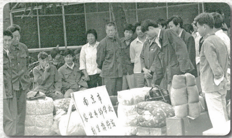
原南京市农业专科学校在中央门长途汽车站设新生接待站