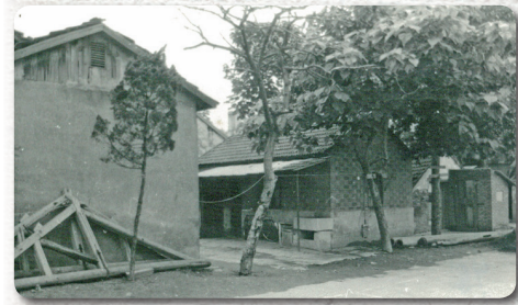
原南京市金陵职业大学图书馆

编者按：上下求索，岁月如歌。翻开档案就仿佛打开了记忆的窗户，那些奋斗的身影，那些付出的辛劳，那些闪耀的荣光……都藏在一册册案卷中。穿越在档案的海洋里，那光阴里的故事又将被捡起，那逝去的芳华又将熠熠生辉。我校档案馆近期特别举办了“档案里的故事”征集活动，现刊登部分优秀作品。