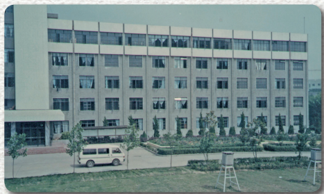
原南京市农业专科学校教学楼

你见过他们从前的样子吗？你一定不记得了，看见老照片，或许从他们的眉宇间能看到一点如今的影子，陌生又熟悉，然后感叹某某人发福了，头发也花白了，虽然一直都是那样的精气神儿，那是时代，也是经历，是在时光打磨的缝隙里藏住的那些不变的气质。