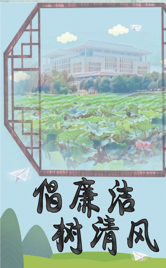
《那片纯净》作者：张璐