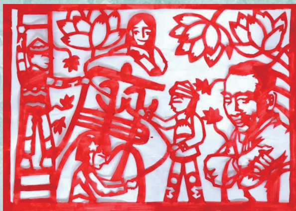
《共建清廉路》作者：叶明龙